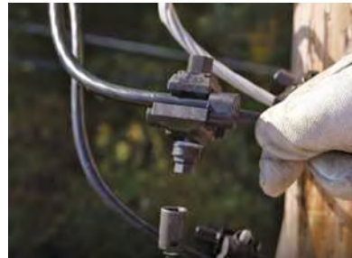
Figure 2 – vue d'ensemble des câbles et du connecteur

de serrage est atteint, le boulon se sectionne indiquant que les mâchoires du connecteur ont percé l'isolant et sont solidement en contact avec les conducteurs assurant un joint entre les fils du triplex et ceux du branchement client.