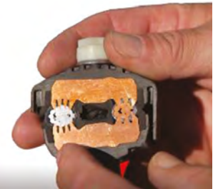
Figure 3 – Vue intérieure du connecteur et câbles

Les connecteurs à perforation sont utilisés depuis longtemps dans les milieux salins afin de réduire au maximum la corrosion accélérée des parties exposées des conducteurs; donc, ils ont fait leurs preuves.