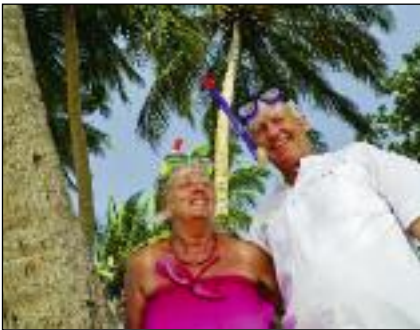
Une protection en accident-maladie pour préretraités et retraités qui voyagent est maintenant offerte

Le comité exécutif de la CMEQ a reconduit, en date du 1 er avril 2012, le Programme personnalisé en assurance de personnes dédié aux entrepreneurs électriciens offert par la firme Michel Rhéaume et associés (MRA). Avec ce renouvellement, plus que jamais, les membres de la Corporation ont accès à un programme d'assurance taillé sur mesure répondant à leurs besoins, à des conditions avantageuses.